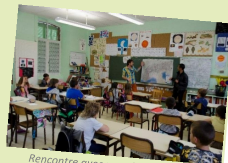
Rencontre avec une classe Phénoclim

Au printemps 2015, avec l'aide de Serge Giraud, enseignant EMALA 1 , ils sont ainsi allés à la rencontre de la classe de Salira