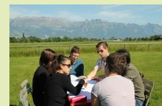
Petits dialogues de jeunes... lors des rencontres internationales au Liechtenstein