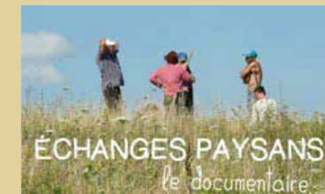
Bêtes à laine, bêtes à lait Bêtes à cornes, bêtes à crocs