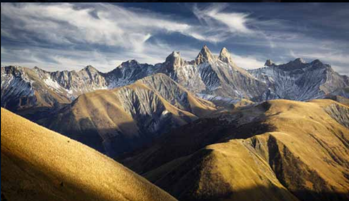
Vue panoramique sur les aiguilles d'Arves, composées de trois sommets: l'aiguille Méridionale [3514 m], l'aiguille Centrale [3513 m] et l'aiguille Septentrionale [3358 m]. Massif des Arves - Savoie

Toutes ces montagnes de France nous invitent à l'émerveillement, au dépassement de soi et au ressourcement. Beauté, immensité et sérénité façonnent cette promenade, au fil des saisons, sur les chemins de randonnée, les sentiers escarpés, les pics rocheux, les parois vertigineuses, jusqu'aux plus hautes cimes enneigées. Je forme le vœu que ces témoignages photographiques exceptionnels vous incitent à partir à la découverte de ces territoires de montagne et de leurs habitants qui, par leur force de caractère et leur dynamisme, apportent une contribution significative à la stratégie touristique de la France et à la préservation de nos espaces naturels. Le Sénat souhaite également, par cette exposition, saluer l'action de tous les élus de la montagne.