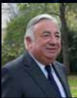
Gérard Larcher Président du Sénat