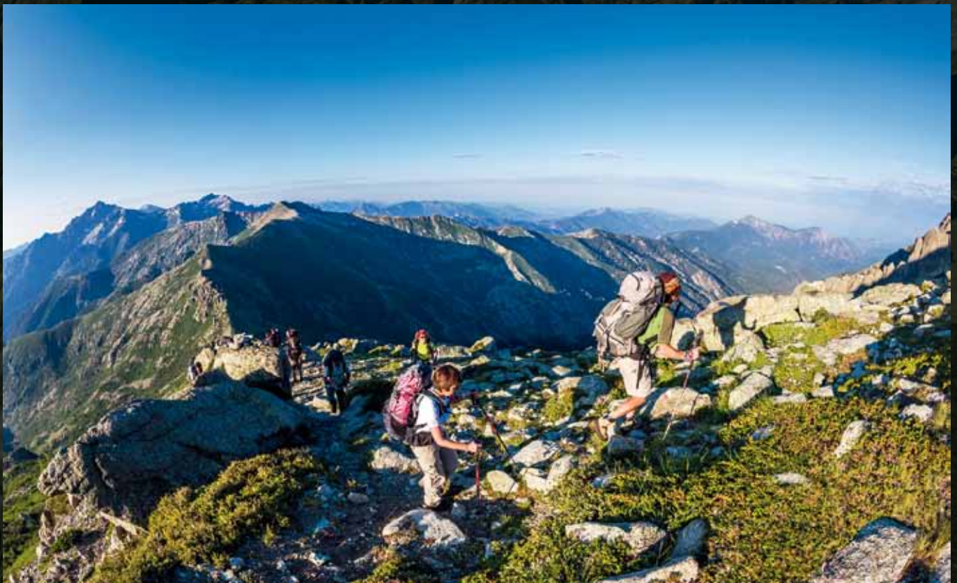
Soleil levant sur le Monte d'Oro [2 389 m], entre le col de Vizzavona et la bergerie de l'Onda, sur le tracé du mythique GR°20. Ce sentier de grande randonnée est considéré comme l'un des plus beaux, mais aussi des plus difficiles d'Europe. Parc naturel régional de Corse

• Entrée libre - Renseignement et inscription: emmanuelle.kerbati@bayard-territoires.com